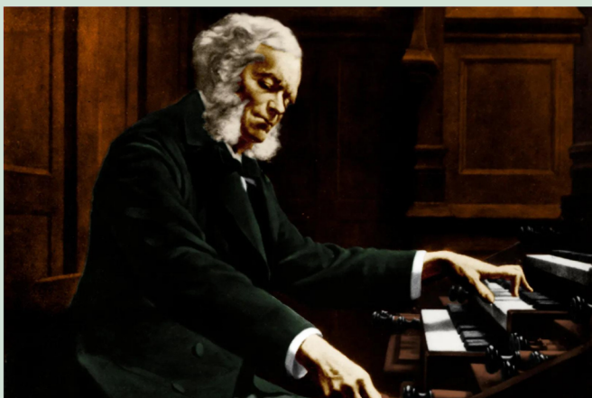
César Franck (1822-1890)

Tous les rendez-vous sont gratuits Ouverture des portes 30 min avant les spectacles